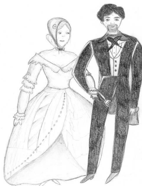
Vypracovala: Petra Houčková