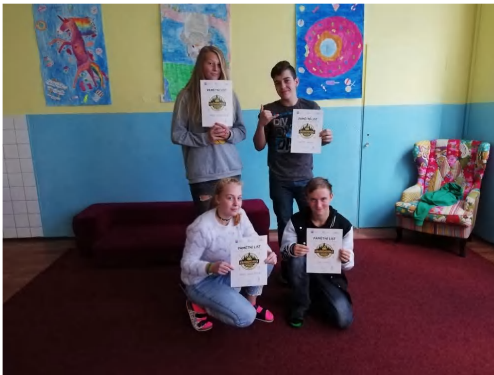
Vypracovali: Jan Kanis, Zdeněk Paulus, Adéla Šindelářová, Šárka Kvasničková

Jako doprovodný program jsme si mohli vyzkoušet brýle, které simulovaly opilost (0.8 promile), opilost+prášky, marihuana, tvrdé drogy, LSD/Extáze. Měli jsme možnost si prohlédnout zbraně zkusit detektor kovu a simulace střelby zbraně na cíl. Bylo to super a stálo to za to!